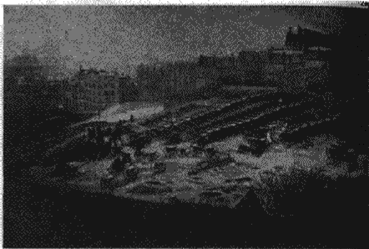
محل استقرار توپخانه گارد ملی در مونمارتر