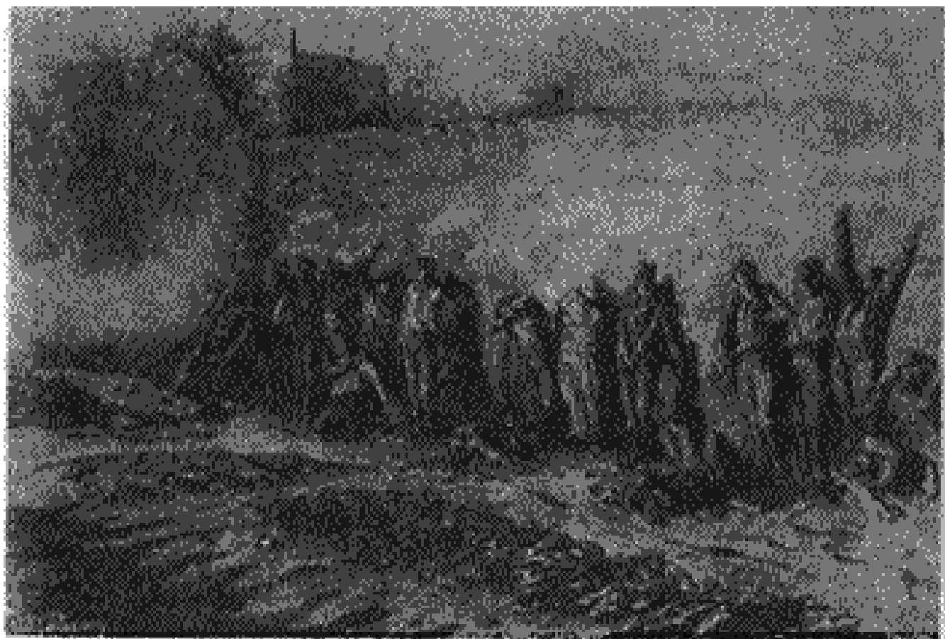
تابلوی دیوار هم پیمانان (موزة لوور)