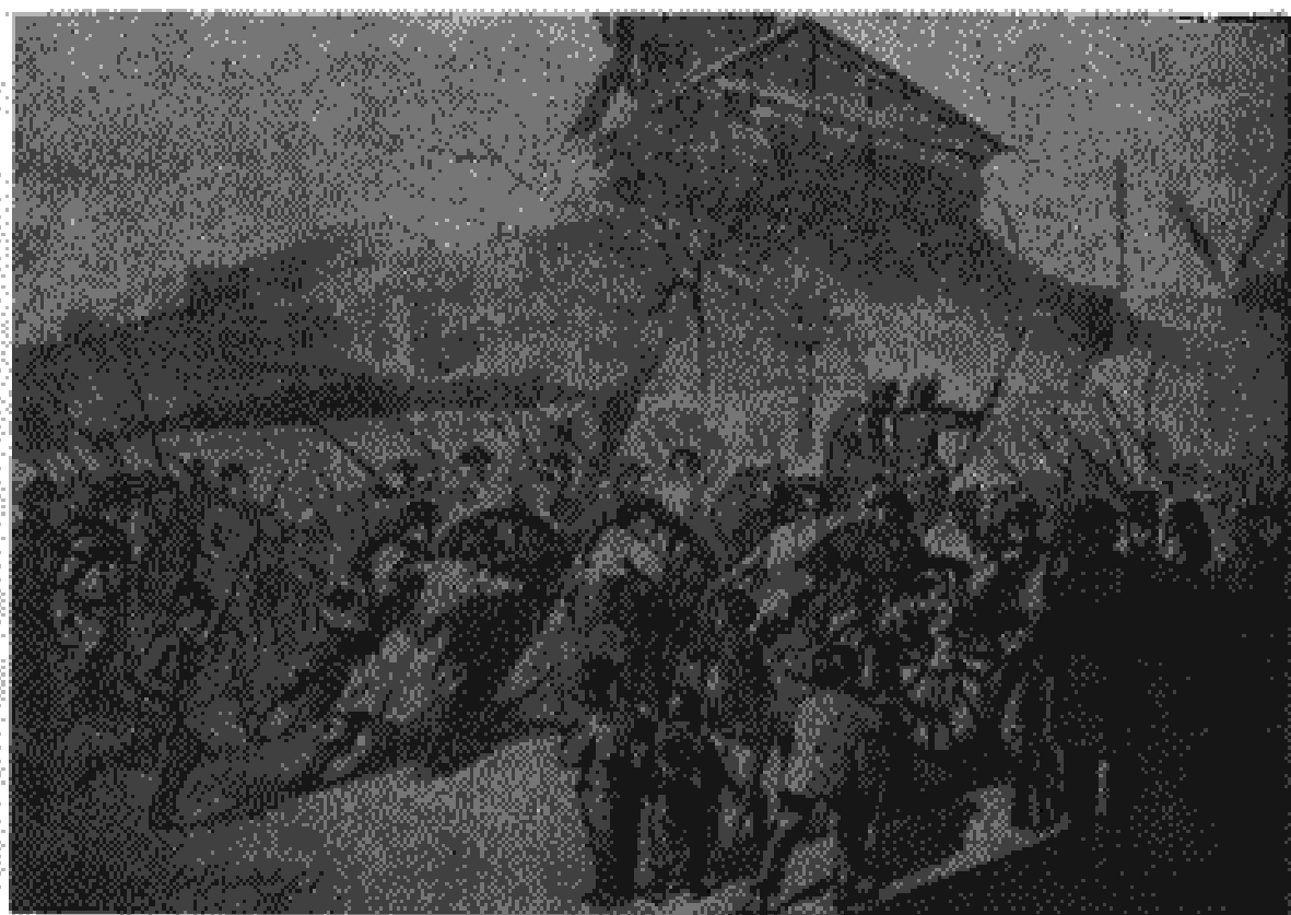
افراد گارد ملی، با کمک مردم، توپخانه خود را پس می‌گیرند و به مونمارتر برمی‌گردانند.